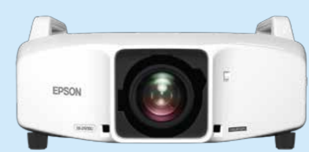
Erwecken Sie Ihr visuelles Marketing zum Leben

Definieren Sie das Einkaufserlebnis Ihrer Kunden neu.