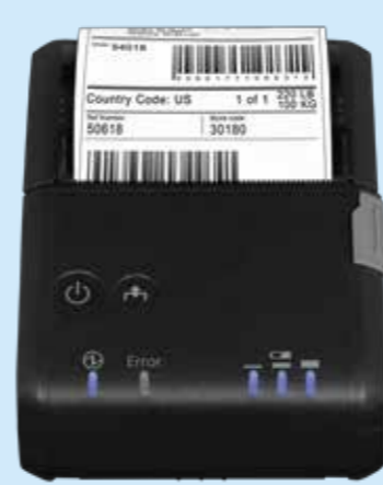
Auch mobil effizient Drucken