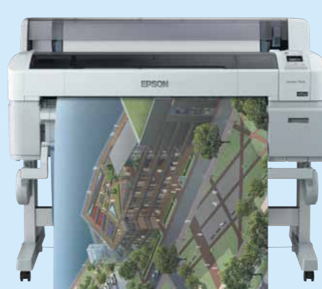
Beeindruckende Werbung im Laden