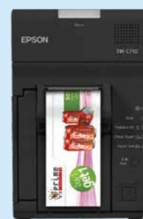
Mehr Kundenbindung mit Farbcoupons